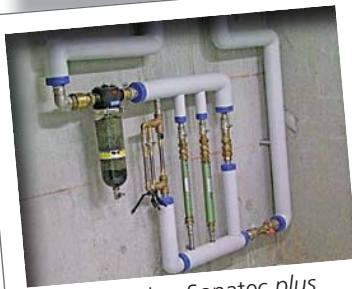
Installation Sonatec plus (ici exemple pour bâtiment public)