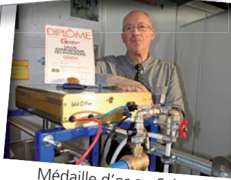
Médaille d'or au Salon des Inventons de Genève 2014