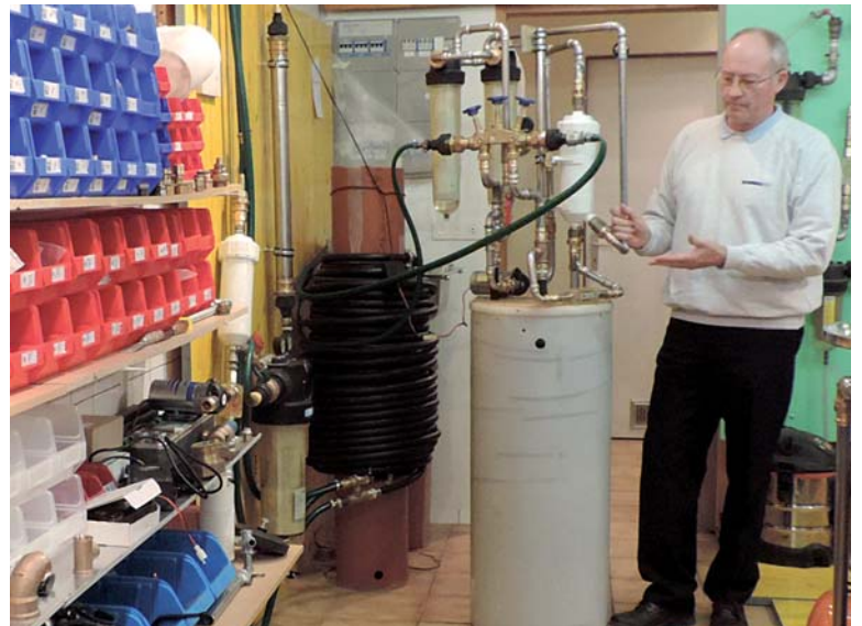
1 er prototype Sonatec 3s plus, installé pour tests chez un client.

Les premiers prototypes, de cette nouvelle génération, fonctionnent à satisfaction mais doivent être standardisés pour lancer la production industrielle. C'est pourquoi nous faisons appel à vous.