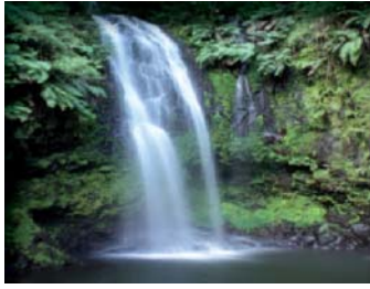
De la source...